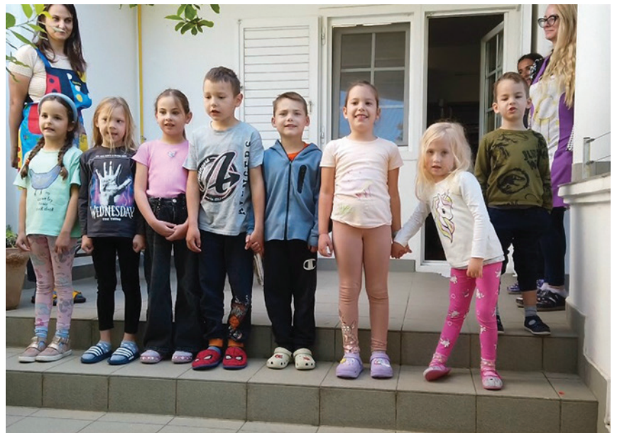
I piccoli allievi dell'Asilo "Pinocchio" mentre intonano la canzone di Sergio Endrigo "Ci vuole un fiore"