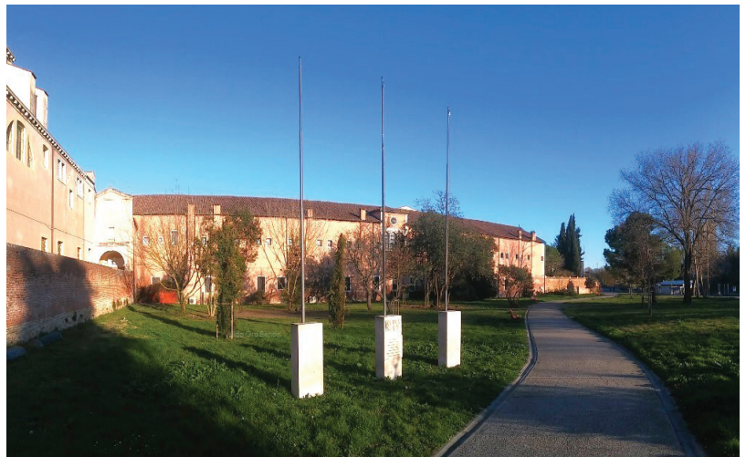
I Piloni Dalmati a San Nicolò