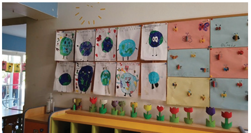
Alcuni dei lavori creativi dei bambini, esposti in un'aula dell'Asilo