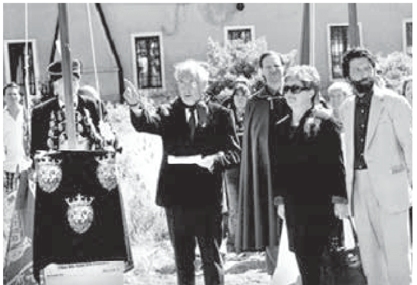
Storica inaugurazione dei Piloni Dalmati, maggio 2005