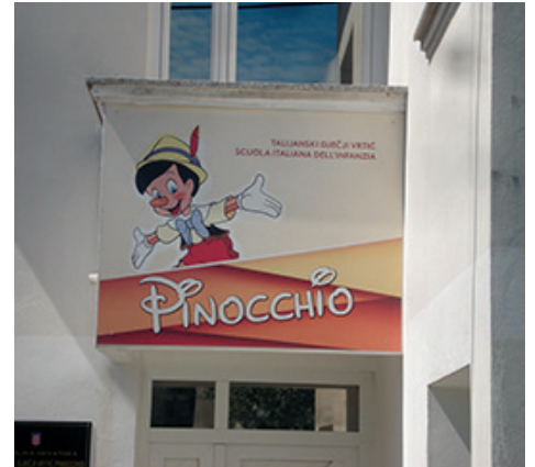
L'insegna della Scuola Italiana dell'Infanzia "Pinocchio" a Zara

La pubblicazione delle immagini è stata autorizzata dalla Direzione dell'Asilo "Pinocchio".