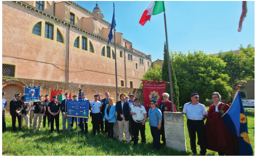
Lido di Venezia, 1° giugno 2025, Festa della Sensa