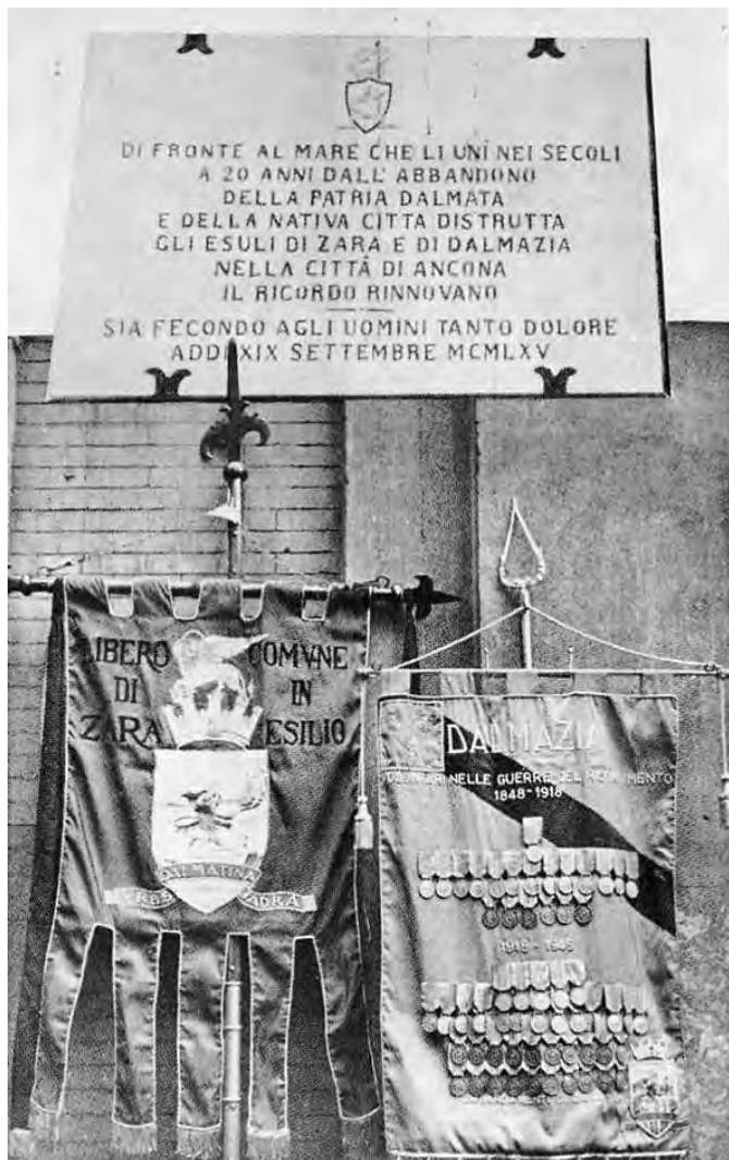
Ancona, lapide posata nel 1965 a ricordo degli esuli dalmati