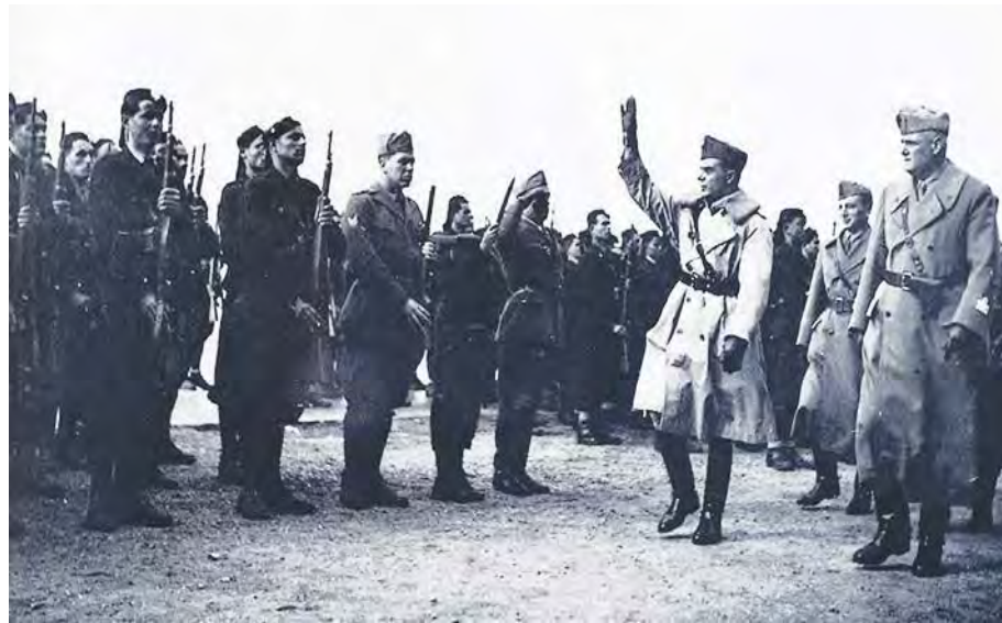
Il Governatore di Dalmazia Giuseppe Bastianini

Il decreto di annessione della Dalmazia all'Italia fu pubblicato il 7 giugno 1941 nella Gazzetta Ufficiale del Regno. Il