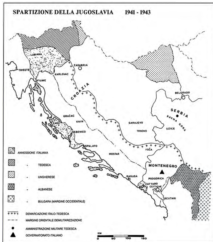
Spartizione della Jugoslavia dal libro Le operazioni in Jugoslavia (1941-43) , Ufficio storico dell'esercito

lunga serie di incontri e trattative tra Pavelić e Mussolini, si giunse infine alla stipula del Trattato di Roma il 18 maggio 1941, con il quale l'Italia acquisì la maggior parte della Dalmazia e delle isole, mentre alla Croazia restavano solo pochi sbocchi al mare di secondaria importanza a nord di Zara, a sud di Spalato e nelle vicinanze di Ragusa. I territori rimasti sotto la sovranità croata rimasero comunque fortemente controllati dall'Italia, in quanto la II Armata presidiava tutta la zona sud-occidentale della Croazia per una profondità di circa 100 chilometri, sino a congiungersi con le forze armate germaniche che stazionavano nella fascia orientale balcanica. Tale decisione da parte italiana era dovuta alla debolezza delle forze armate croate, che stentavano ad affrontare sia l'esercito dei cetnici serbo comandato dal Generale Draža Mihajlović sia le prime brigate partigiane comuniste capeggiate da Tito. Lo Stato Indipendente di Croazia libero dal giogo serbo, pur con le pesanti limitazioni territoriali stabilite dal Trattato di Roma con l'Italia e da quello di Zagabria con la Germania, aveva acquisito una fi-