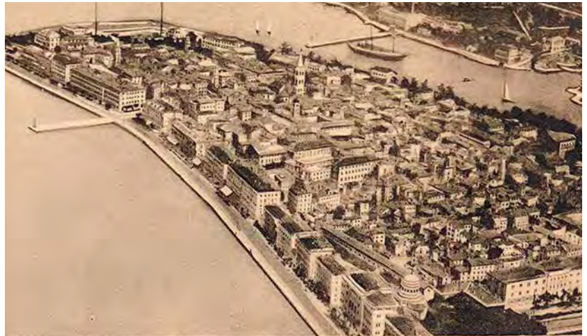
Zara d'Italia. Panorama, 1925

Nel resto della Dalmazia agli inizi degli anni Trenta i porti costieri passati alla Jugoslavia (Sebenico, Spalato e Ragusa) non godevano di un grande sviluppo. Una delle ragioni principali del mancato decollo economico risiedeva nell'inefficienza del sistema viario e ferroviario dell'entroterra jugoslavo. I porti erano malamente colle-