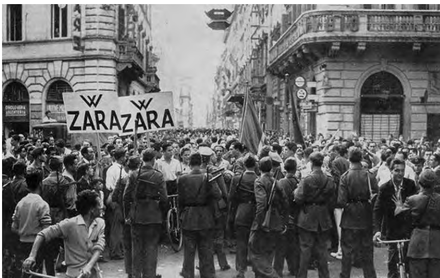
Roma, manifestanti zaratini contro il trattato di pace di Parigi del 1947