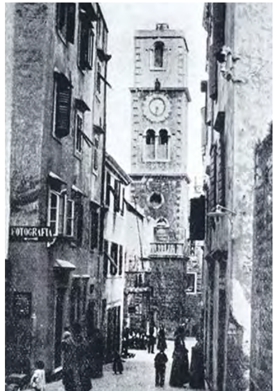
Sebenico, torre dell’Orologio

Un risultato ritenuto allora insperato. Dai territori dalmati rimasti sotto il nuovo Stato slavo del sud, cominciarono dal 1920 in poi ad affluire i primi profughi italiani. Avvenne così un primo esodo italiano che coinvolse tra il 1920 e il 1930 forse 5000/6000 persone, ma un calcolo esatto è a tutt’oggi difficile da fare. Il censimento del 1910 calcolò 18.500 italiani in Dalmazia compresa Zara, ma altre stime sono concordi a stabilire una cifra più alta di circa 25.000. Nonostante il primo esodo dei dalmati iniziato dal 1920 in poi, in base a un censimento della Banovina croata del 1938 gli italiani residenti in Dalmazia sotto la Jugoslavia, al di fuori di Zara, risultavano essere ancora 4500. Ulteriori accordi per la tutela degli italiani dalmati rimasti nello stato slavo del sud, che dal 1929 diventerà il Regno di Jugoslavia, furono firmati solo nel 1925, in concomitanza con le Convenzioni di Nettuno. Alla fine, solo Zara e la piccola isola di Lagosta passarono con la stipula di un trattato internazionale all’Italia, ma con gravi limitazioni territoriali foriere di futuri contrasti con gli jugoslavi.