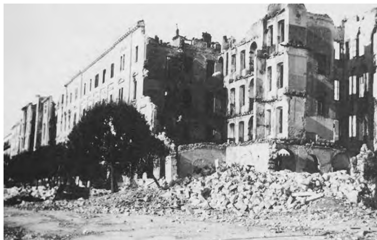
Zara, bombardamento aereo, novembre 1943

di quel tragico 1943, un pesante bombardamento aereo americano colpì nuovamente Zara, causando circa 200 morti e altrettanti feriti oltre ad ingenti danni materiali. Per sfuggire al pericolo aereo iniziò in pieno inverno un primo esodo degli zaratini, costretti a trasferirsi nelle campagne circostanti e nelle isole. Molte persone decisero, invece, di prendere i pochi piroscafi disponibili per raggiungere Trieste. Il 16 dicembre ci fu un altro bombardamento, che distrusse molti edifici e causò decine di morti. Il 30 dicembre 1943 ci fu un ennesimo lancio di bombe particolarmente pesante, durante il quale rimasero distrutti l'ospedale civile e gran parte della zona industriale. La frequenza e l'intensità dei bombardamenti su Zara fece pensare a molti za-