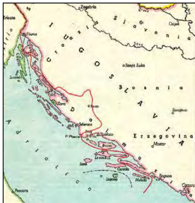
Mapa del patto segreto di Londra, 1915. La linea rossa delimita il territorio promesso all'Italia