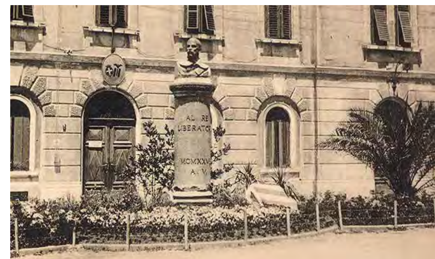
Zara, busto di Re Vittorio Emanuele III, posto nel 1927