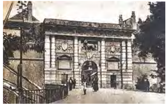
Zara, Porta Terraferma