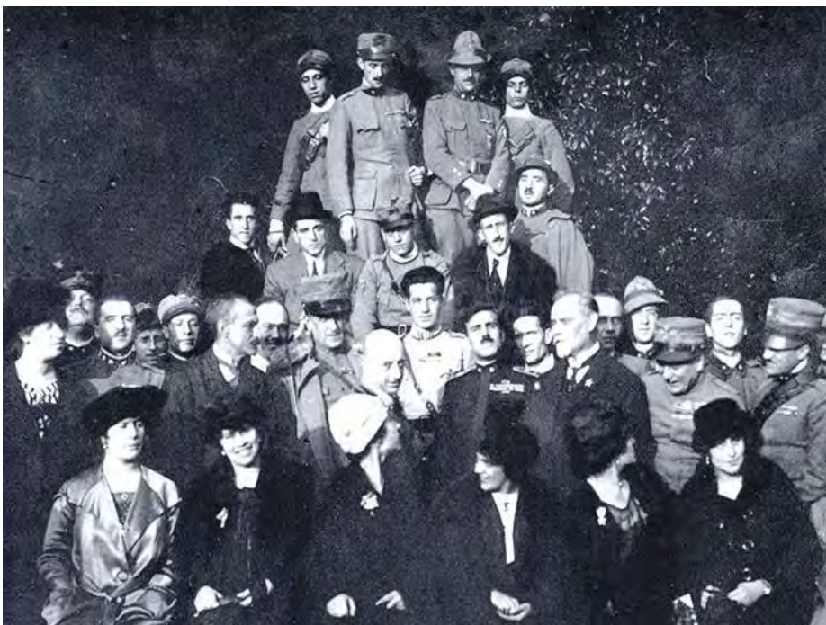
Delegazione di zaratini a Fiume. Al centro D'Annunzio, Rizzo e Ziliotto

Sotto il governo presieduto da Nitti fu firmata la pace con l'Austria, ma senza stabilire una precisa configurazione dei confini tra l'Italia e il nuovo Stato dei serbi, croati e sloveni. In una situazione così indefinita si vennero a creare una serie di eventi contraddittori, che contrassegnarono negativamente le relazioni diplomatiche tra italiani e alleati. Nel giugno 1920 Nitti si dimise e al suo posto subentrò Giovanni Giolitti, che con il ministro degli Esteri Carlo Sforza cercò di risolvere una volta per tutte la questione adriatica, che vedeva in ballo non solo la Dalmazia ma anche Fiume. Sforza era deciso a mantenere Zara e fare di Fiume uno Stato libero, impegnandosi a cacciare anche con la forza militare i legionari dannunziani dalla città quarnerina. Il 31 ottobre del 1920 Sforza comunicò agli ambasciatori d'Italia a Londra e a Parigi la notizia imminente dell'inizio delle trattative diplomatiche per la soluzione adriatica con la controparte slava. All'accordo definitivo con lo Stato dei serbi, croati e sloveni si giunse il 12 novembre con la firma del Trattato di Rapallo. All'Italia per effetto del trattato restarono soltanto le isole di Cherso e Lussino a nord e le isole di Lagosta e di Pelagosa a sud, il comune