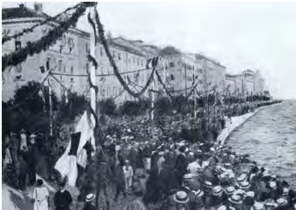
Novembre 1918: gli zaratini attendono lungo la Riva Nuova l’arrivo delle navi italiane

I dirigenti politici delle nazionalità slave dell’Austria-Ungheria alla fine di settembre si erano già attivati per preparare un’insurrezione interna rivoluzionaria e indipendentista basandosi sui quattordici punti del Presidente statunitense Thomas W. Wilson. Tra il 26 e il 27 ottobre 1918 vennero esautorati a Spalato e a Sebenico i rappresentanti