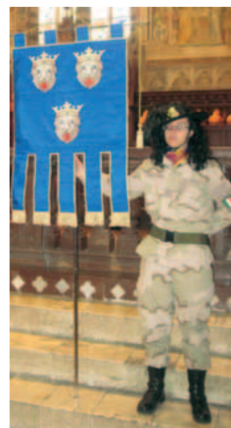
Una donna bersagliere con il labaro di Dalmazia alla Santa Messa