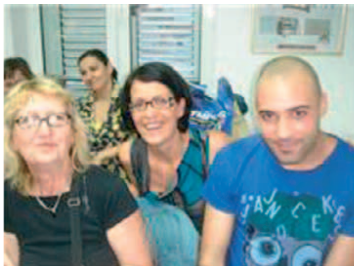
Non hanno potuto essere presenti al Raduno, perché impegnati nelle lezioni, gli insegnanti e gli allievi del Liceo linguistico - informatico di Spalato, che ci hanno inviato un saluto e questa foto