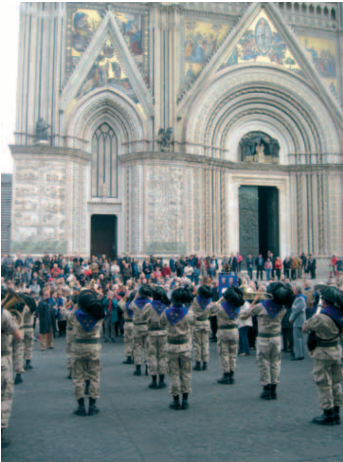
FOTO DEL RADUNO DI ORVIETO