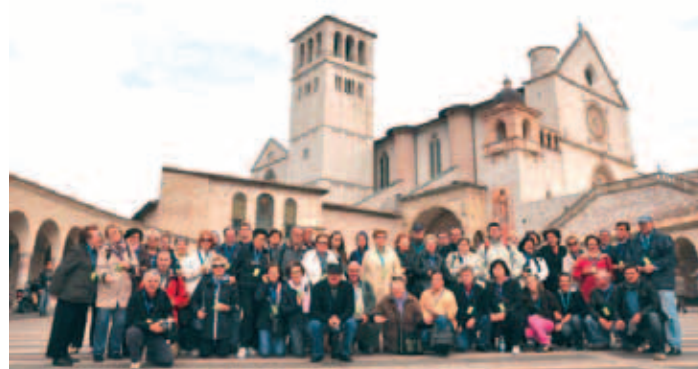
Nell'ambito del viaggio d'istruzione in Umbria, organizzato per conto degli aderenti alle Comunità italiane di Dalmazia dall'Università popolare di Trieste, un folto gruppo di residenti in Dalmazia ha potuto essere presente al 57° Raduno.