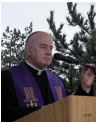
Il Vescovo di Trieste, mons. Eugenio Ravignani

Nel complesso monumentale sorto intorno alla Foiba di Basso, il Sindaco Dipiazza ha voluto riservare un ampio spazio ad una tipica costruzione carsica nella quale trove-